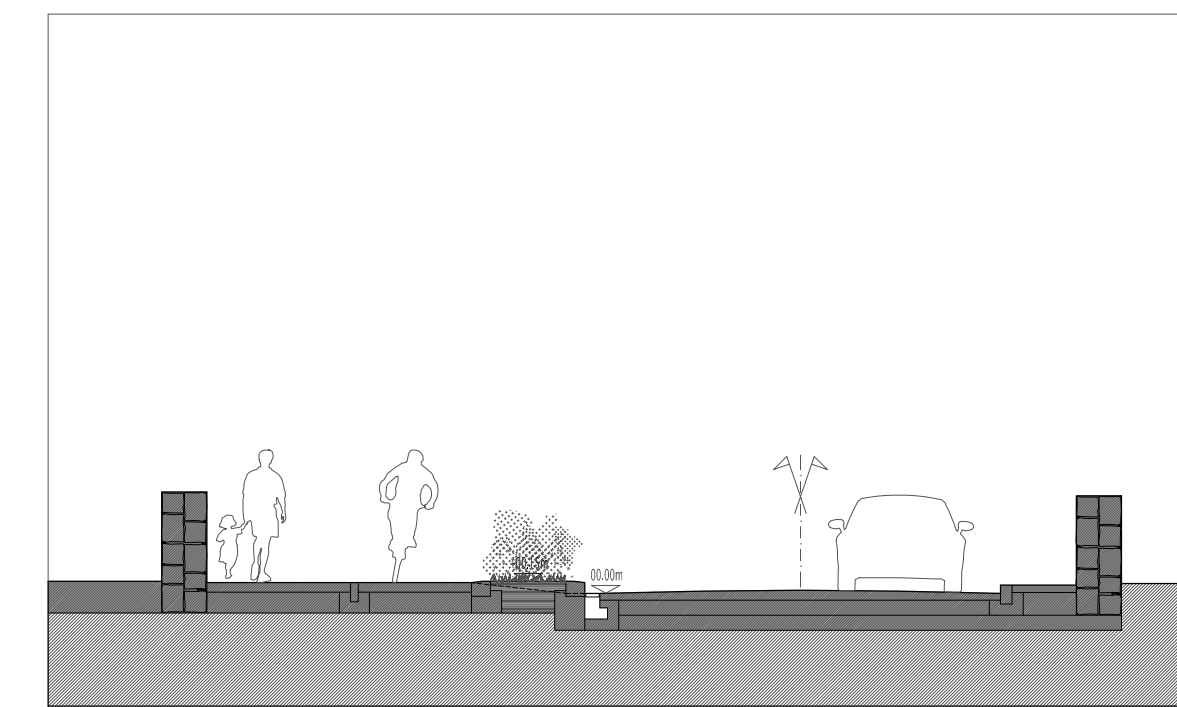
PERFIL TIPO TRANSVERSAL

requerente: Câmara Municipal de Ribeira Grande Largo Cons. Hintze Ribeiro 9600-509 Ribeira Grande Unidade de Execução ÁREA TURÍSTICA DO MORRO DE BAIXO Ribeira Grande, Açores PERFIS TIPO Via Principal e Passeio/Ciclovia